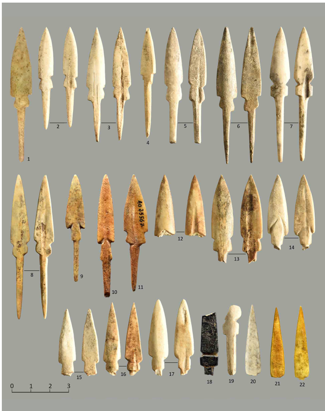
Fig. 1: Bone arrowheads with a leaf-shaped blade from Ziwiye; These samples are housed in The Metropolitan Museum of Art (No. 1; ©The Metropolitan Museum of Art, Photo by: Narges Bayani), Sanandaj Museum (Nos. 2 to 8, 12 to 20; ©The Sanandaj Museum, photo by: Nima Fakoorzadeh and Neda Tehrani), Musée du Louvre / Antiquités Orientales Department (Nos. 9 to 11; ©Musée du Louvre, photo by: Yousef Hassanzadeh), National Museum of Iran (Nos. 21 to 22, ©National Museum of Iran, Photo by: Yousef Hassanzadeh).